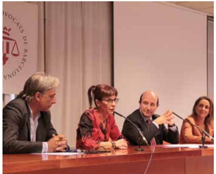
12 de juliol: Dia de la Justícia Gratuïta i de l'advocat d'ofici. Enguany, el dia es va dedicar a reivindicar el sistema de justícia gratuïta i el torn d'ofici.