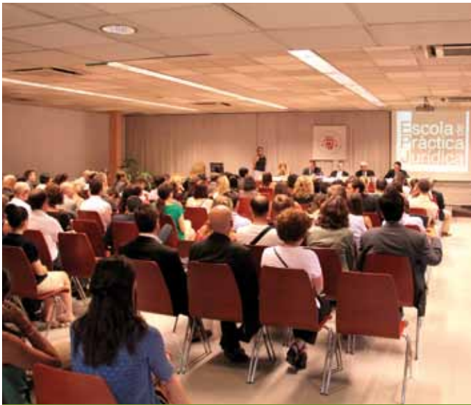
5 de juliol: Entrega de Diplomes de l'Escola de Pràctica Jurídica (EPJ).