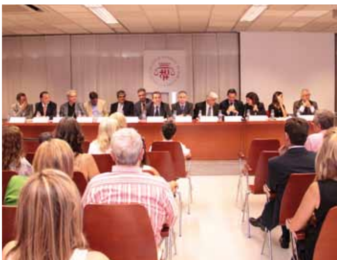
18 de juliol: Lliurament de diplomes campus ICAB.