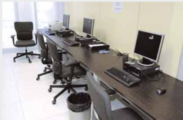
Interior de les dependències de l'ICAB a la Ciutat de la Justícia

Al les dependències de l'ICAB em diuen que ells no tenen targetes, però que si és un tema d'ofici jo no he de pagar les fotocòpies i m'ensenyen un mail on s'hi adjunta una comunicació electrònica amb una instrucció del Departament de Justícia on hi diu que "de manera provisional i per garantir l'obtenció de còpies gratuïtes als professionals del torn d'ofici, s'ha acordat que , a partir d'aquest moment es pot facilitar l'accés als