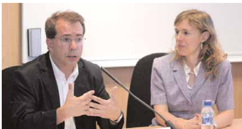
El passat 26 de juny la Secció de Dret Penal va organitzar un nou cafè criminal, aquest cop sota el títol 'Tècniques de seducció de l'advocat penalista'