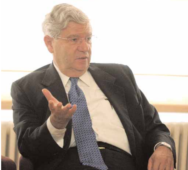
Recepció al CICAC de l'expresident de la Cort Suprema a Israel, Aharon Barak.