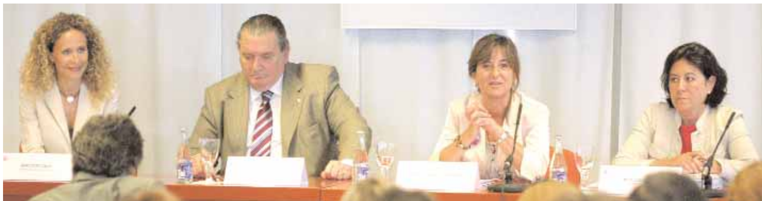
L'acte de clausura de l'Escola Judicial va tenir lloc el 30 de juny