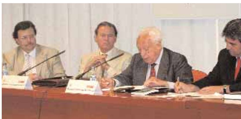
La Secció de Dret Constitucional va organitzar el passat 2 de juliol un conferència titulada "El presidencialisme encobert o la transformació d'un règim polític".