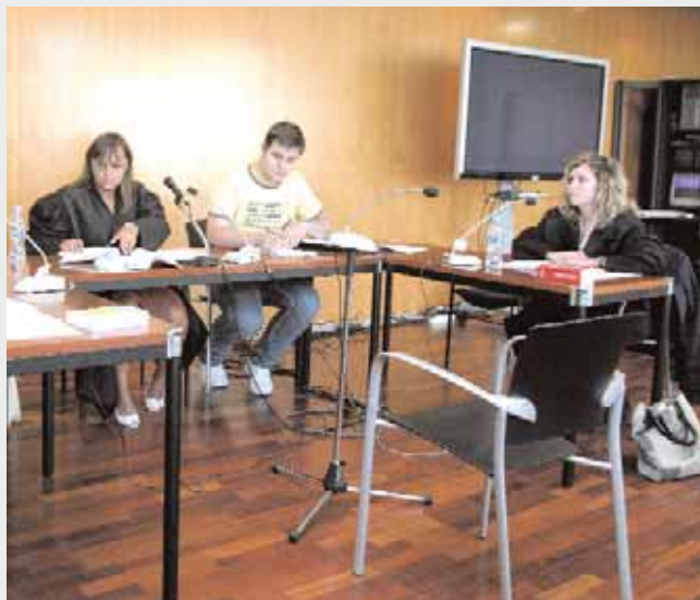
Alumnes de l'EPJ fent pràctiques a l'Escola Judicial.

S'amplien els horaris lectius, per tal de garantir la màxima optimització de l'aprenentatge, es formaran grups reduïts de 20 a 24 alumnes per classe. Per conèixer la realitat dels despatxos i el "dia a dia" de la professió es faran pràctiques externes.