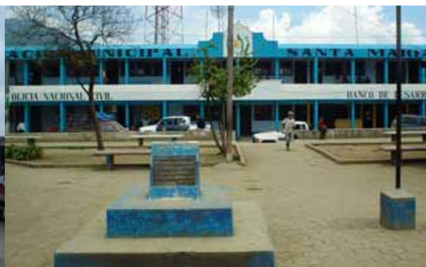
Sèrie d'instantànies de la vida quotidiana de Nebaj, realitzades per Daniel Salvadó. D'esquerra a dreta: dones cuinant, la terminal d'autobusos i l'ajuntament.